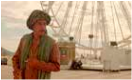
As mil e uma noites