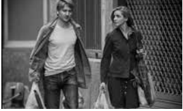
L'Ombre des femmes