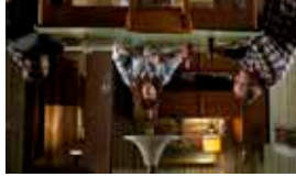
Le Tout Nouveau Testament