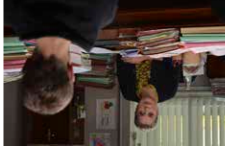
La Tête haute

Under the auspices of the European Film Forum which was launched this year, the European Commission has organised a series of meetings in Cannes with the professionals, creators and heads of companies contributing to the dynamism and diversity of the European audiovisual industry. These events aim to allow the Commission, represented by Commissioner Günther H. Oettinger, to exchange views with the professionals and other stakeholders on the current developments in the audiovisual sector.