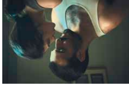
Une histoire de fou