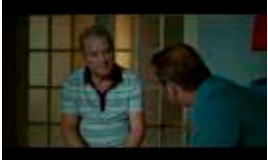
Un Etaj Mai Jos