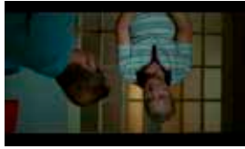
Un Etaj Mai Jos

Ni le Ciel ni la Terre by Clément Cogitore