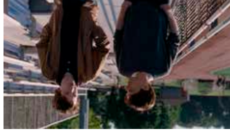
Louder Than Bombs