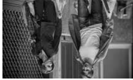
L'Ombre des femmes