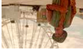
As mil e uma noites