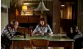
Le Tout Nouveau Testament